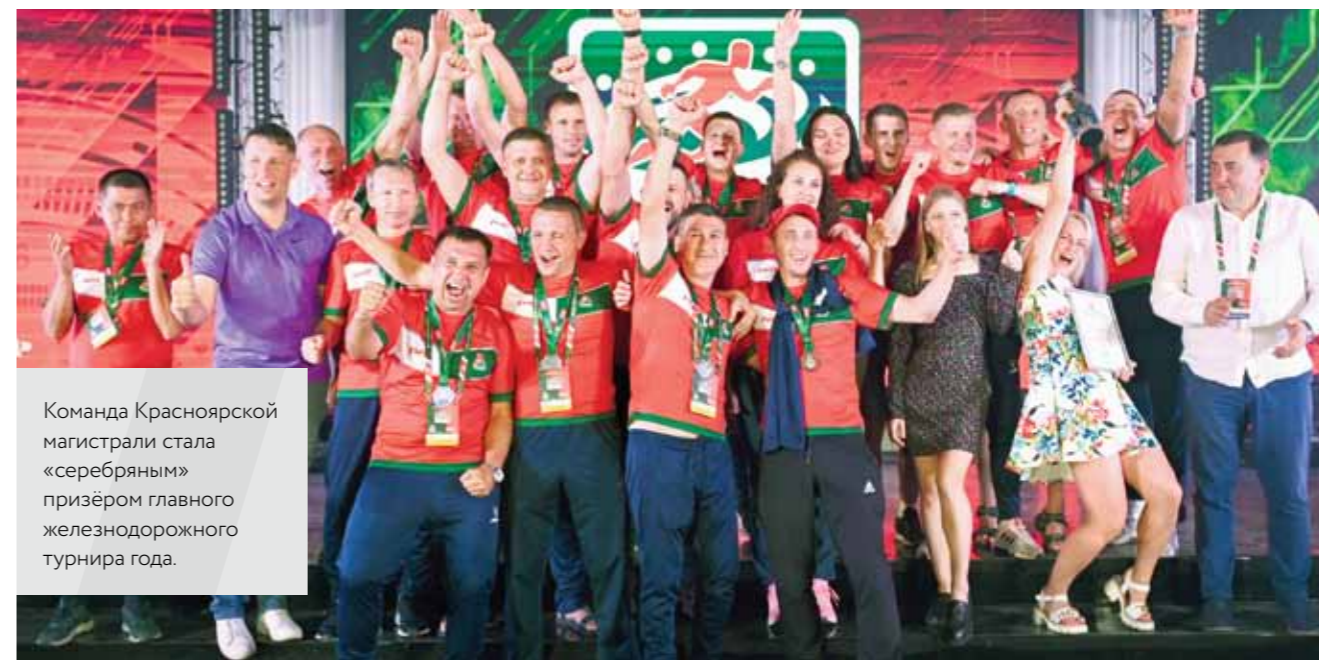
Команда Красноярской магистрали стала «серебряным» призёром главного железнодорожного турнира года.

– Мы выиграли легкоатлетическую эстафету 4 по 200 метров и взяли «серебро» в гиревой эстафете. Это дало нам в общекомандном зачёте первое место в лёгкой атлетике и второе в гиревом спорте.