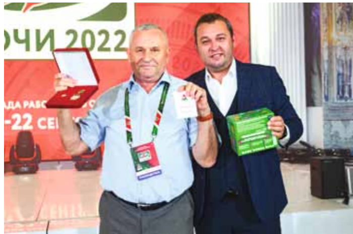
Перед началом церемонии закрытия Почётным знаком РФСО «Локомотив» «за личный вклад в развитие и популяризацию здорового образа жизни среди работников железнодорожного транспорта, многолетний труд на благо спортивного общества железнодорожников» был награждён руководитель Южно-Сахалинского обособленного подразделения