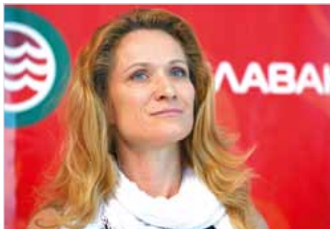
Мария КИСЕЛЕВА, трёхкратная Олимпийская чемпионка

- Таких соревнований должно быть как можно больше. Это именно тот спорт, который нужен для здоровья. Выступления команд сплачивают их участников. Когда не только работаешь вместе, но и проводишь досуг, это приносит огромное удовольствие.