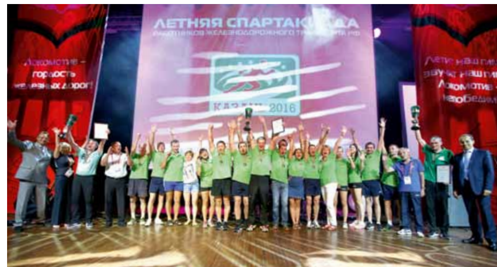
Победитель - сборная Западно-Сибирской магистрали.

Впрочем, не одни сибиряки стали героями Спартакиады. К примеру, представители Московской ж.д. стали лучшими в самом мужественном виде программы – гиревой эстафете. Каждый атлет, участвующий в ней, должен за две минуты успеть поднять над головой тяжелую гирю максимальное количество раз. Поблажек себе давать нельзя – подведешь команду. И на соперника при этом не оглянешься.