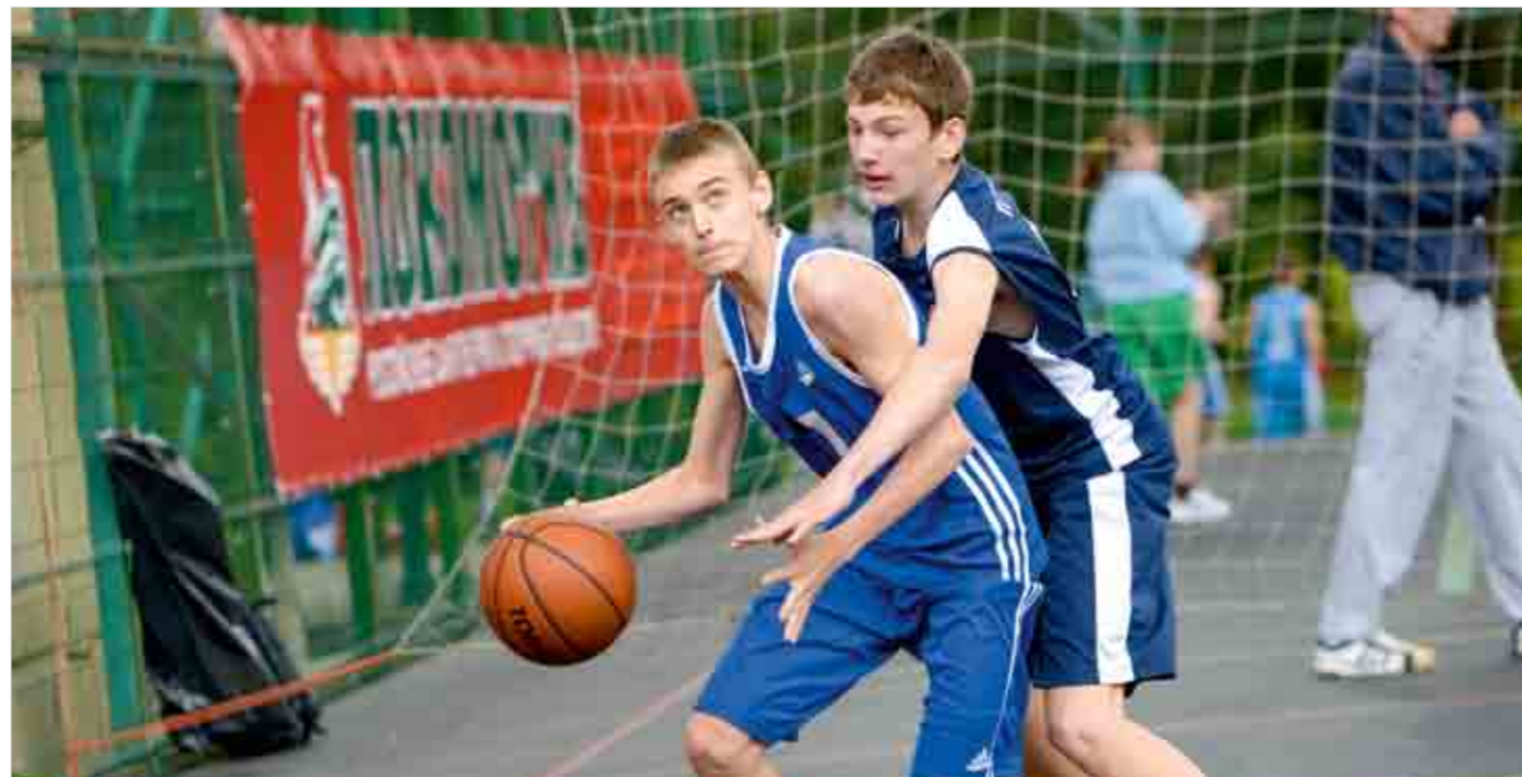
На турнире по стритболу среди мальчиков вне конкуренции оказалась сборная Южно-Уральской железной дороги.