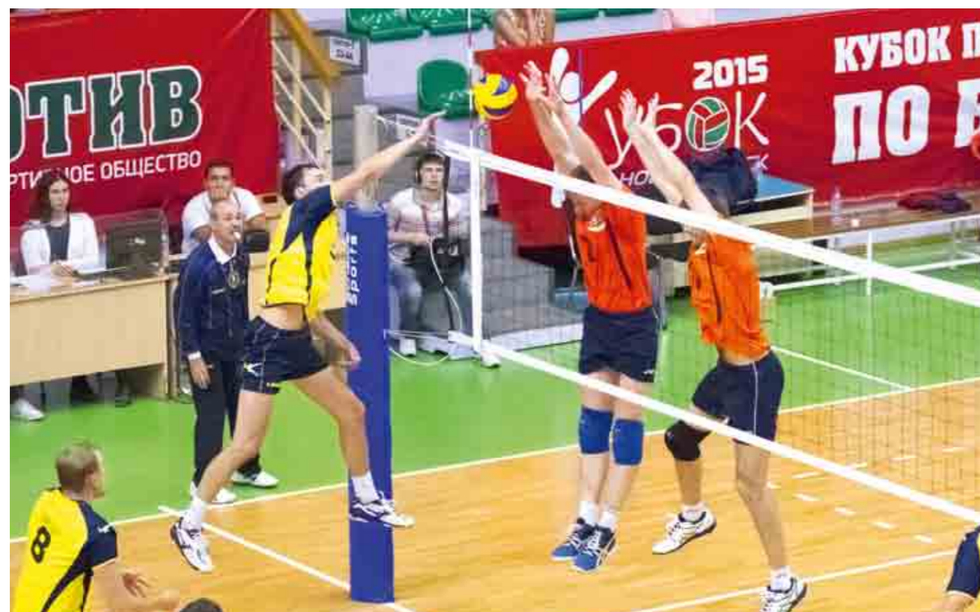
Матч за третье место получился сибирским дерби. В нем встречались команды Западно-Сибирской (справа) и Восточно-Сибирской железной дороги.