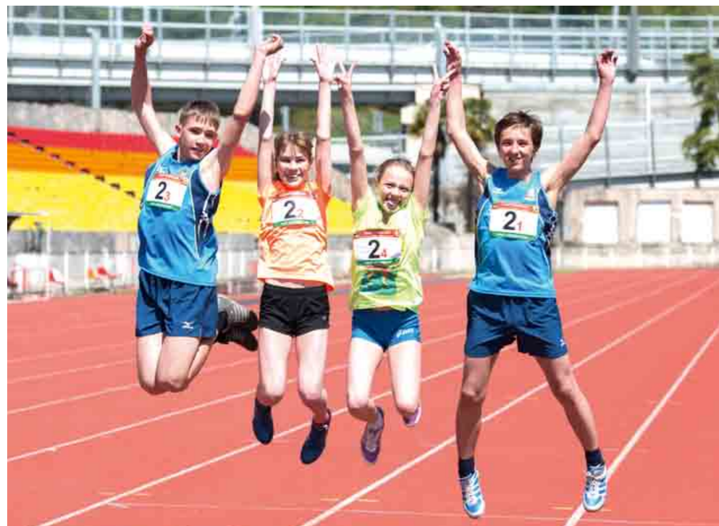
Легкоатлеты Забайкальской магистрали - победители в смешанной эстафете 4x200 м.

Легкоатлеты состязались в беге на 60 метров и