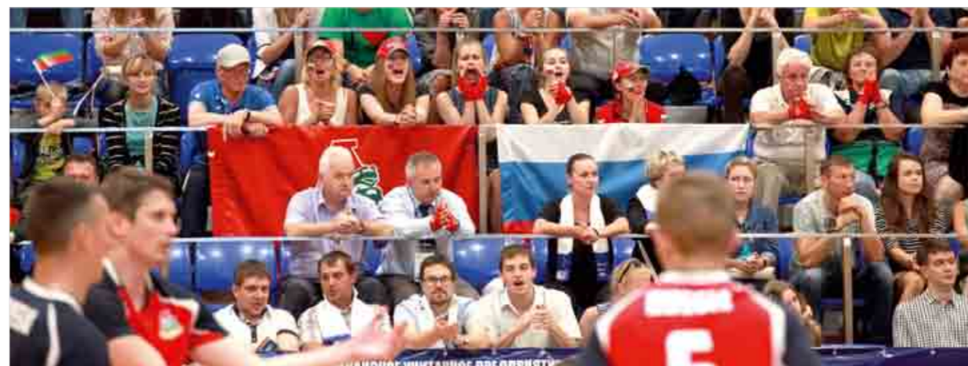
Группа поддержки россиян была самой активной на трибунах.