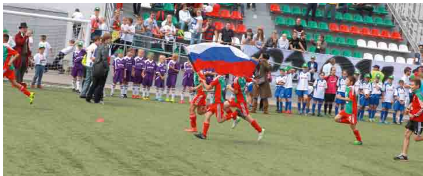
В напряженнейшей борьбе в серии послематчевых пенальти юные футболисты московского «Локомотива» вырвали победу у чемпиона последних двух лет греческого ПАОК.

На этот раз чемпионский Кубок останется в России. А вот победители из «Локомотива» в полном составе отправятся за границу – потренироваться в немецкой академии футбола. Такой полезный приз учредила ФГК для лучшей команды. Но главное, что посмотреть на 11-летних пацанов в «Локоболе» съезжаются специалисты самого серьезного уровня. К примеру, главный тренер ЦСКА Леонид Слуцкий с удовольствием посетил финал. Вручил победителям призы. А затем терпеливо расписывался на бейсболках и делал селфи с финалистами.