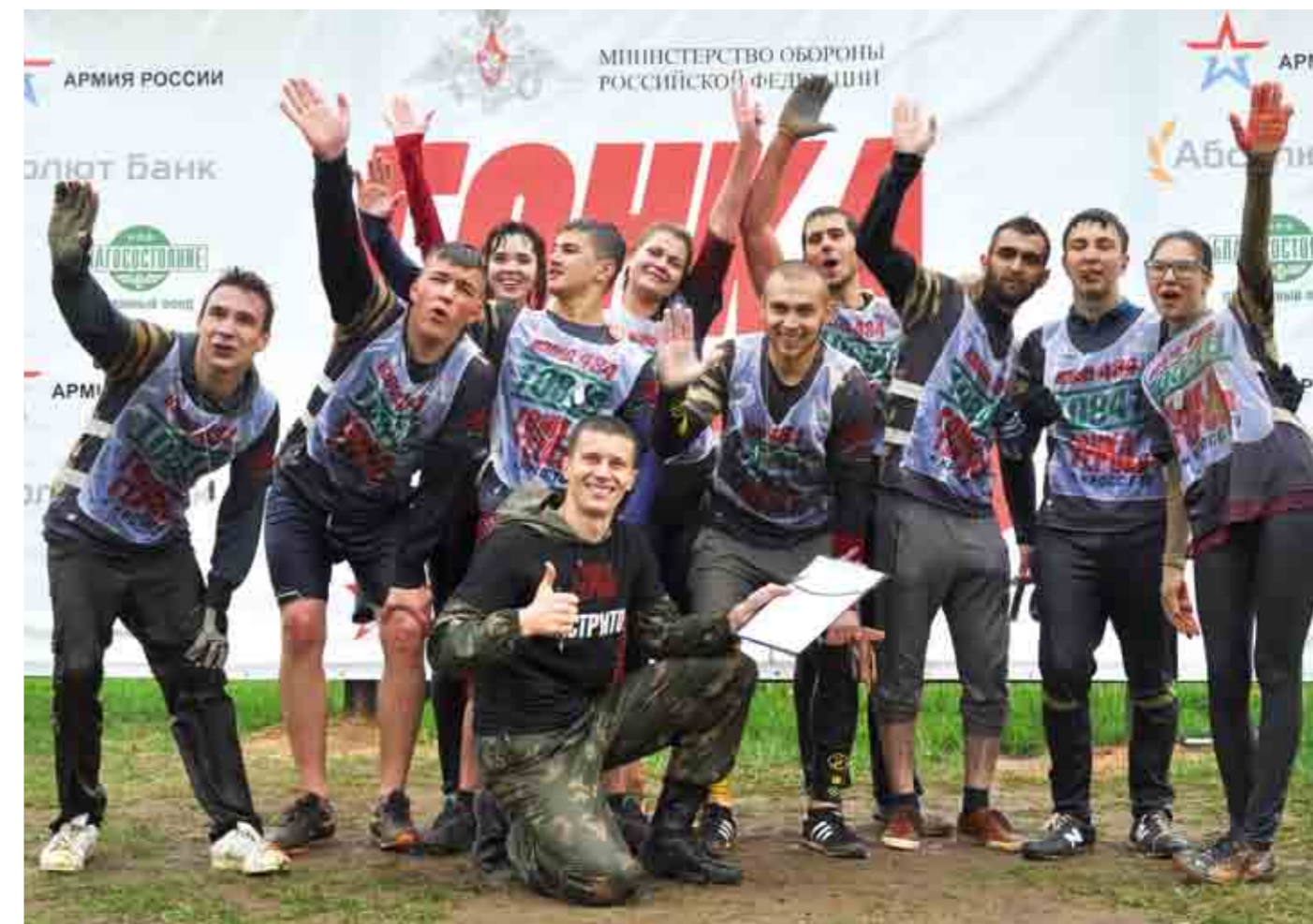
Победитель «Гонки героев» среди студентов МИИТа – 434-й взвод.