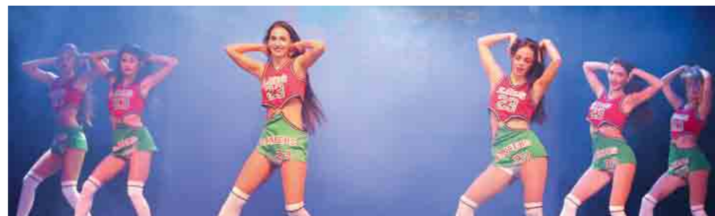
Группа поддержки БК «Локомотив-Кубань» (Краснодар).

– Нам рассказали регламент, поэтому мы знали что будет. Некоторые номера были заготовлены, а в конкурсе капитанов пришлось импровизировать, как и еще в одном конкурсе.