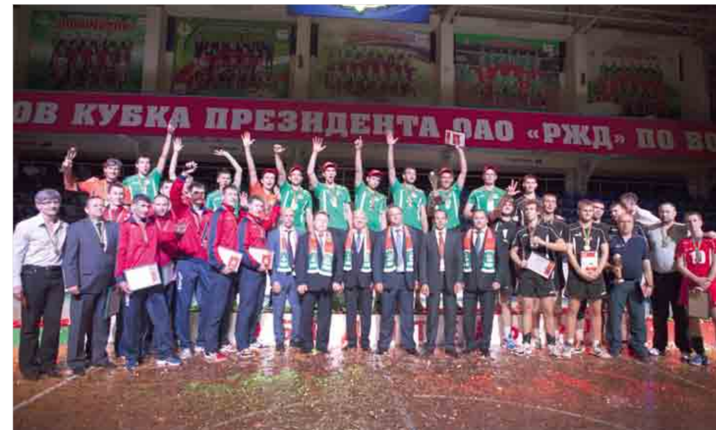
Победители и призеры Кубка президента ОАО «РЖД» по волейболу.

Вот и в этом году Свердловская ж.д. оказалась на втором месте. Западно-Сибирская ж.д. завоевала «бронзу». А представители южных, центральных и западных регионов в этот спор вмешаться не смогли. Никто из них в полуфинал не пробился. Не пора ли подтянуться?