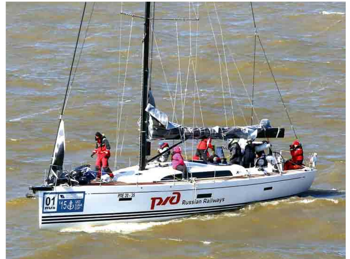
В этом году организаторы предложили участникам более длительные этапы, и почти все они проходили в сложных ветровых условиях.

прохождение этого этапа меньше 20 часов. Следом за ней пришли «Локо» (ОАО «РЖД»), Merion-X («Анкер Логистик»/«Смарт Балк Терминал») и «Premium» (Eesti Raudtee). Принимая во внимание гандикап лодок, такая последовательность финиша была ожидаемой. Весь вопрос состоял в том, на сколько каждая из них опередит своих соперников. И вот здесь интрига сохранялась вплоть до последнего удара судейского колокола, который для первой группы прозвучал через 2 часа после финиша «Анны» (перед главным судейским судном прошла яхта «Premium»), а для второй — лишь в 16.10 по московскому времени, когда завершила гонку команда из Мурманска. Финиш растянулся на добрые 8 часов. Для победы на последнем этапе — и во всей регате — «Локо» было необходимо не отстать от «Анны» больше, чем на час. К сожалению для команды и ее болельщиков, отставание составило 1 час и 20