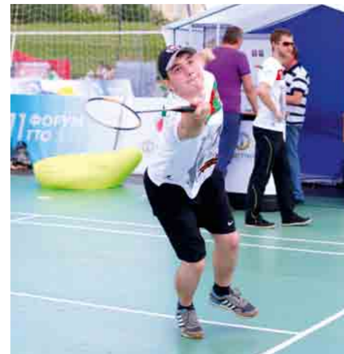
Студенты МИИТа активно участвовали в соревнованиях по бадминтону и настольному теннису.

Первыми в программе были настольный теннис и бадминтон. Погода выдалась хорошая, солнечная и жаркая. И только ветер стал третьим игроком на площадке. Ребята, которые играли на «ветреной» стороне, уступали в матчах очень бы-