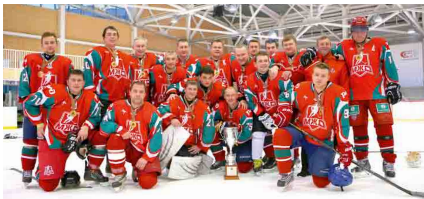
Московские железнодорожники второй год подряд выигрывают престижный трофей.