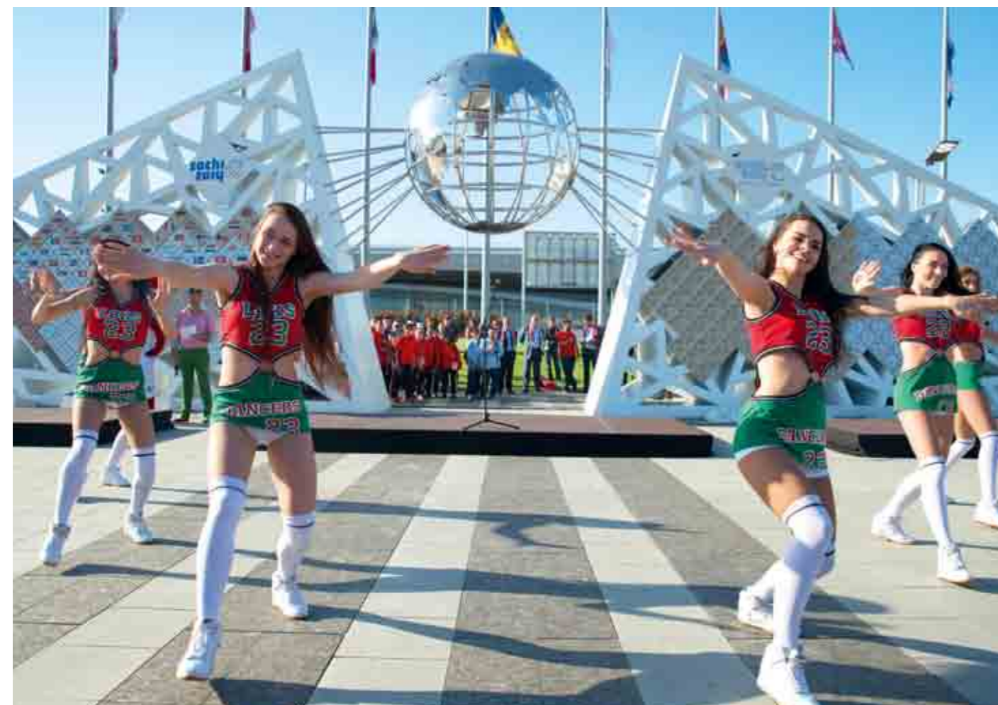
На церемонии закрытия для юных спортсменов выступила специально приглашенная группа поддержки баскетбольного клуба «Локомотив-Кубань».

В стритболе высочайший класс подтвердили свердловчанки, как и год назад выиграв турнир по уличному баскетболу. И это при том, что их команда обновилась почти на сто процентов.