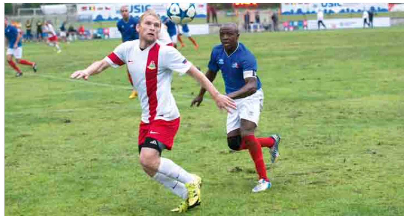
В полуфинале против французской сборной на тяжелом после проливного дождя поле более возрастные россияне проиграли своим оппонентам в скорости.