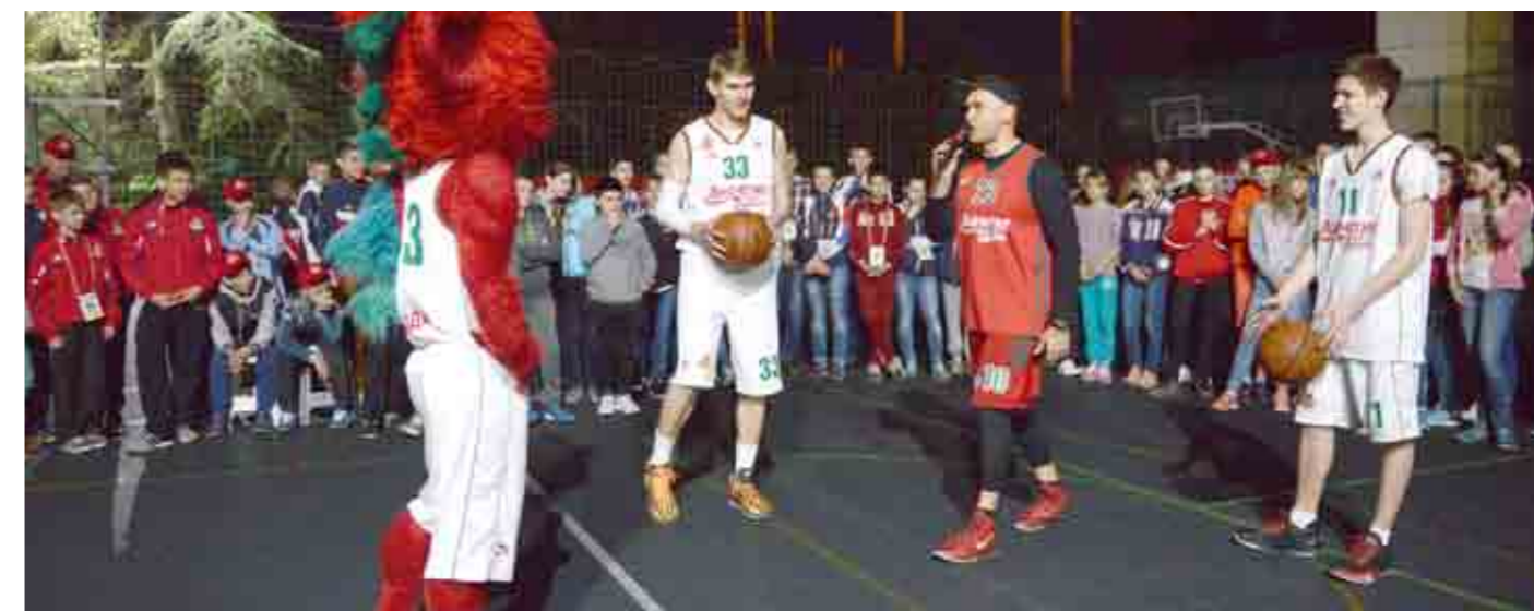
Юные спортсмены с удовольствием поучаствовали в мастер-классе игроков баскетбольного клуба «Локомотив-Кубань».

Отдельная тема соревнований – мастер-классы от известных игроков. Юных футболистов учили чеканить мяч чемпионы мира по пляжному фут-