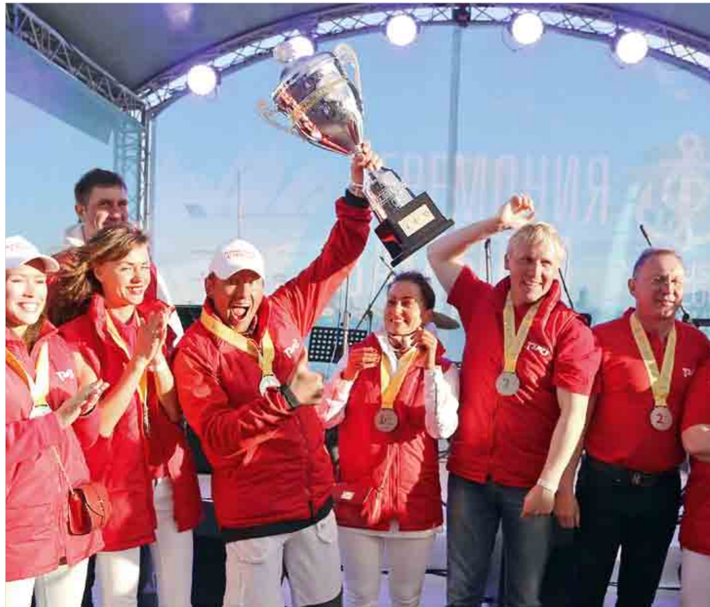
Экипаж яхты «Локо» второй год подряд попадает в призеры престижной международной гонки.

минут. Более того: пришедшая к финишу третьей «Merion-X» после пересчета времени отодвинула обе лидирующие яхты на одну строчку вниз, а вслед за ней и «Premium» еще дальше оттеснила уже все три команды. В итоге у «Локо» лишь 4-е место в гонке и второе – по результатам регаты. А победу в Кубке празднует «Анна».