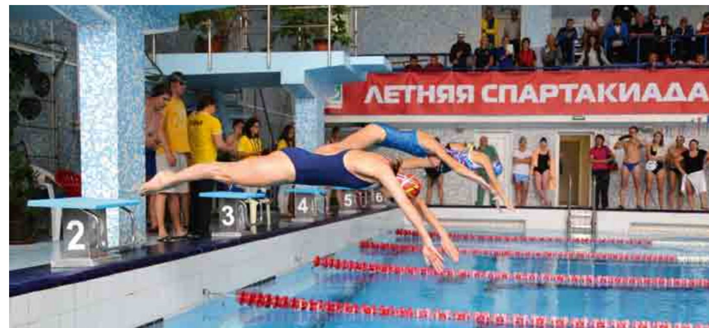
Победа в смешанной эстафете 4x50 м принесла Куйбышевской железной дороге и победу в командном зачете соревнований по плаванию.

Но главная битва развернулась на следующий день в эстафете, где гирию тягала поочередно команда из четырех человек. И здесь уже не было равных москвичам. Они победили и в общекомандном зачете.