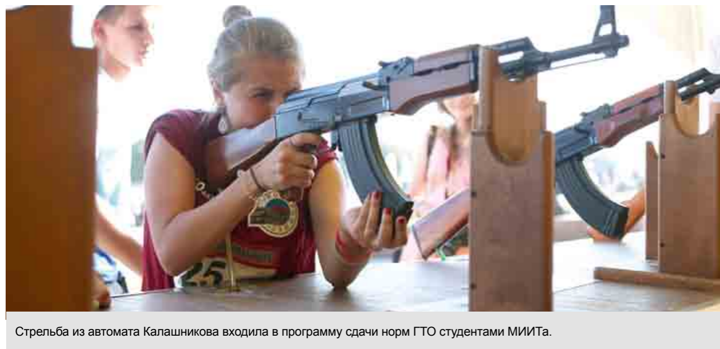
Стрельба из автомата Калашникова входила в программу сдачи норм ГТО студентами МИИТа.