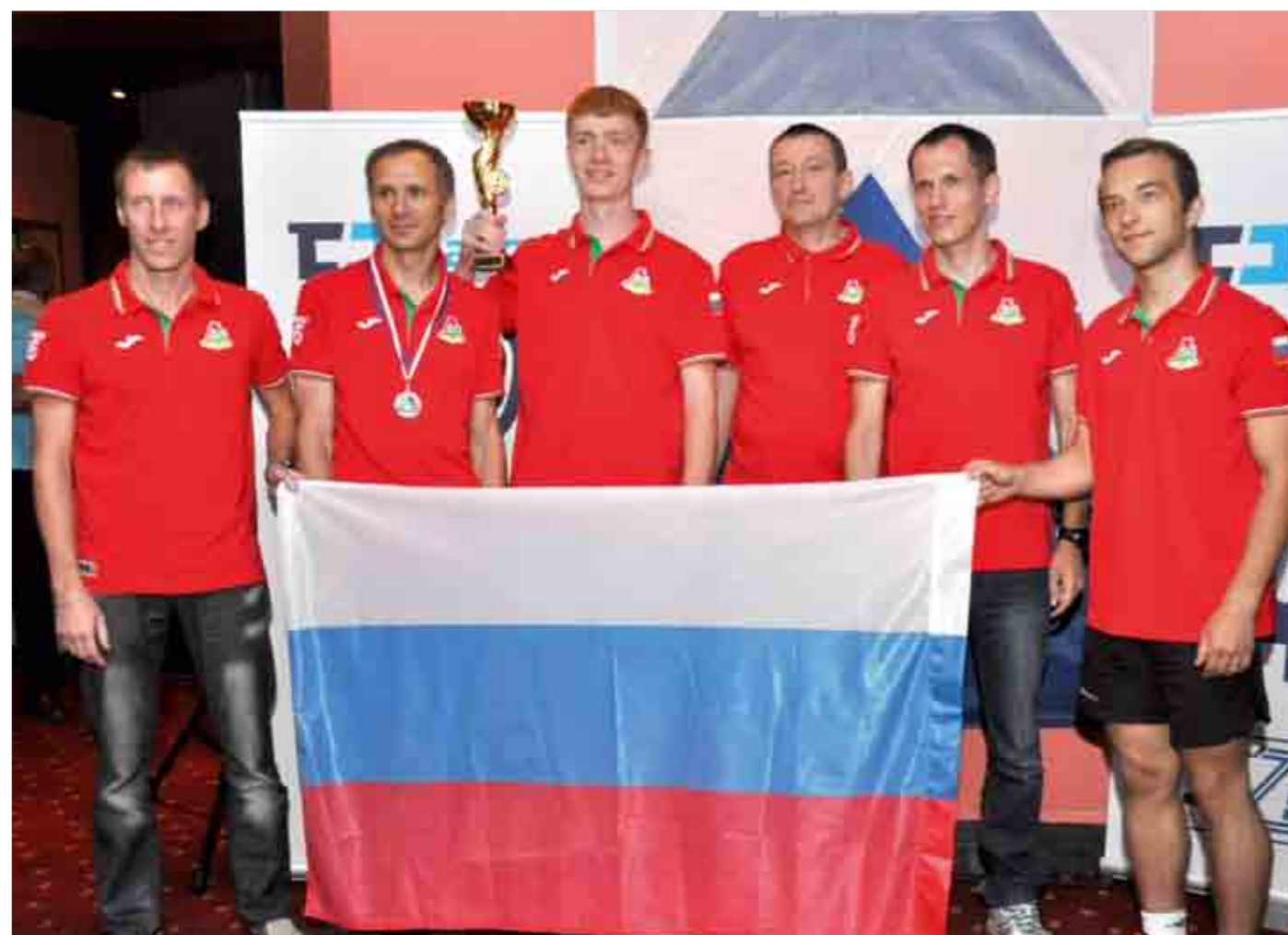
Сборная команда РФСО «Локомотив» на церемонии награждения.