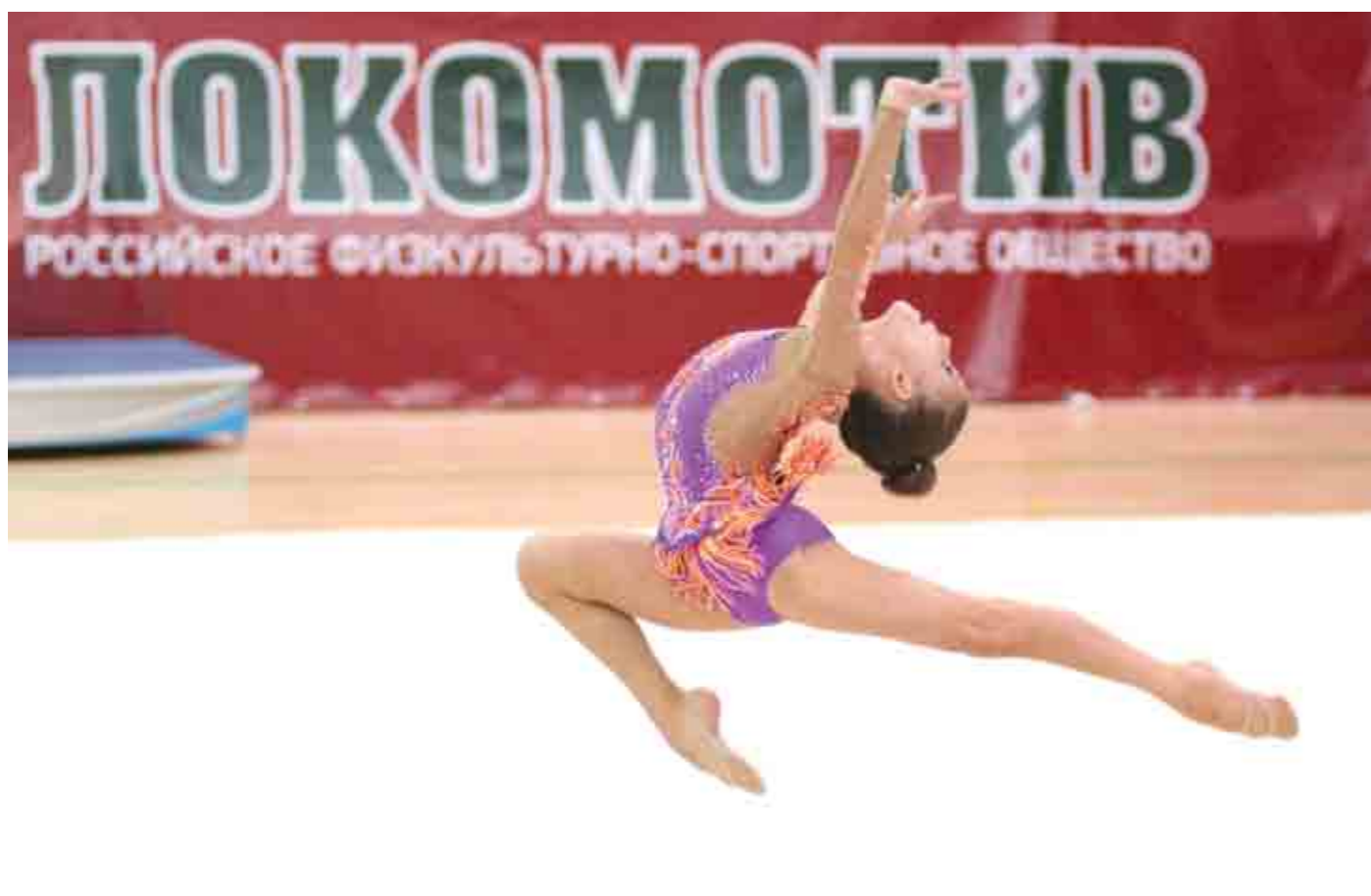
Открытый кубок РФСО «Локомотив» является отборочным этапом формирования сборной для участия в Первенстве России.

Стоит отметить, что турниры РФСО «Локомотив» по художественной гимнастике являются отборочными. На основе их результатов формируется сборная «Локомотив» для участия во всероссийских соревнованиях. А оттуда девочкам открывается дорога в сборную России.