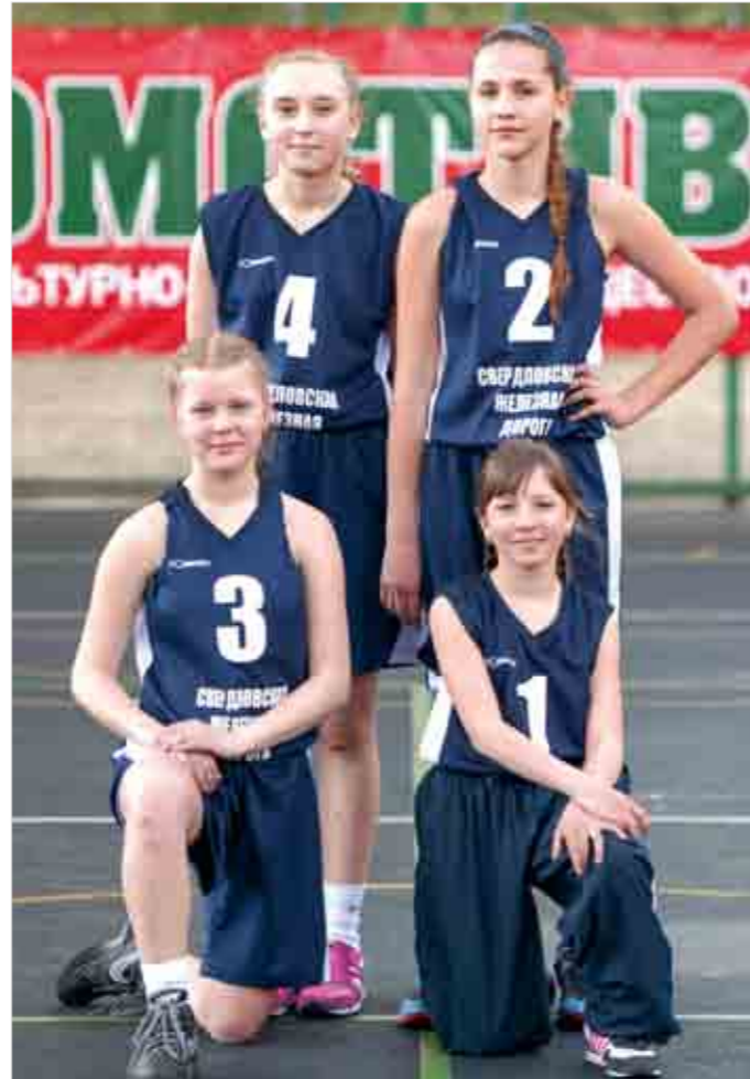
Победитель турнира по стритболу среди девочек - команда Свердловской железной дороги.