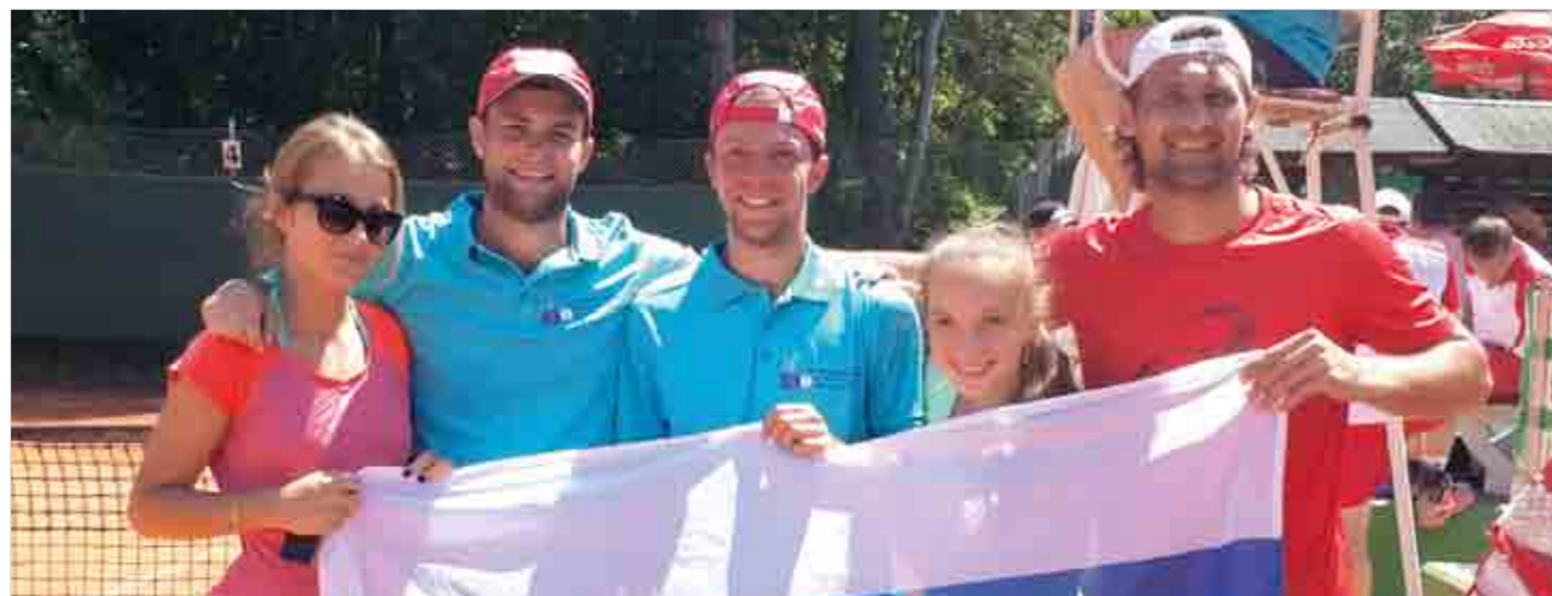
Сборная РФСО «Локомотив» была единственной командой, в составе которой выступали две девушки.

До этого дня у российских железнодорожников было лишь одно поражение - от индийцев и никому не хотелось уступать еще и французам. Но это спорт. В каждом мини-матче каждый член команды РФСО «Локомотив» демонстрировал максимум своих умений, которых на этот раз оказалось недостаточно.