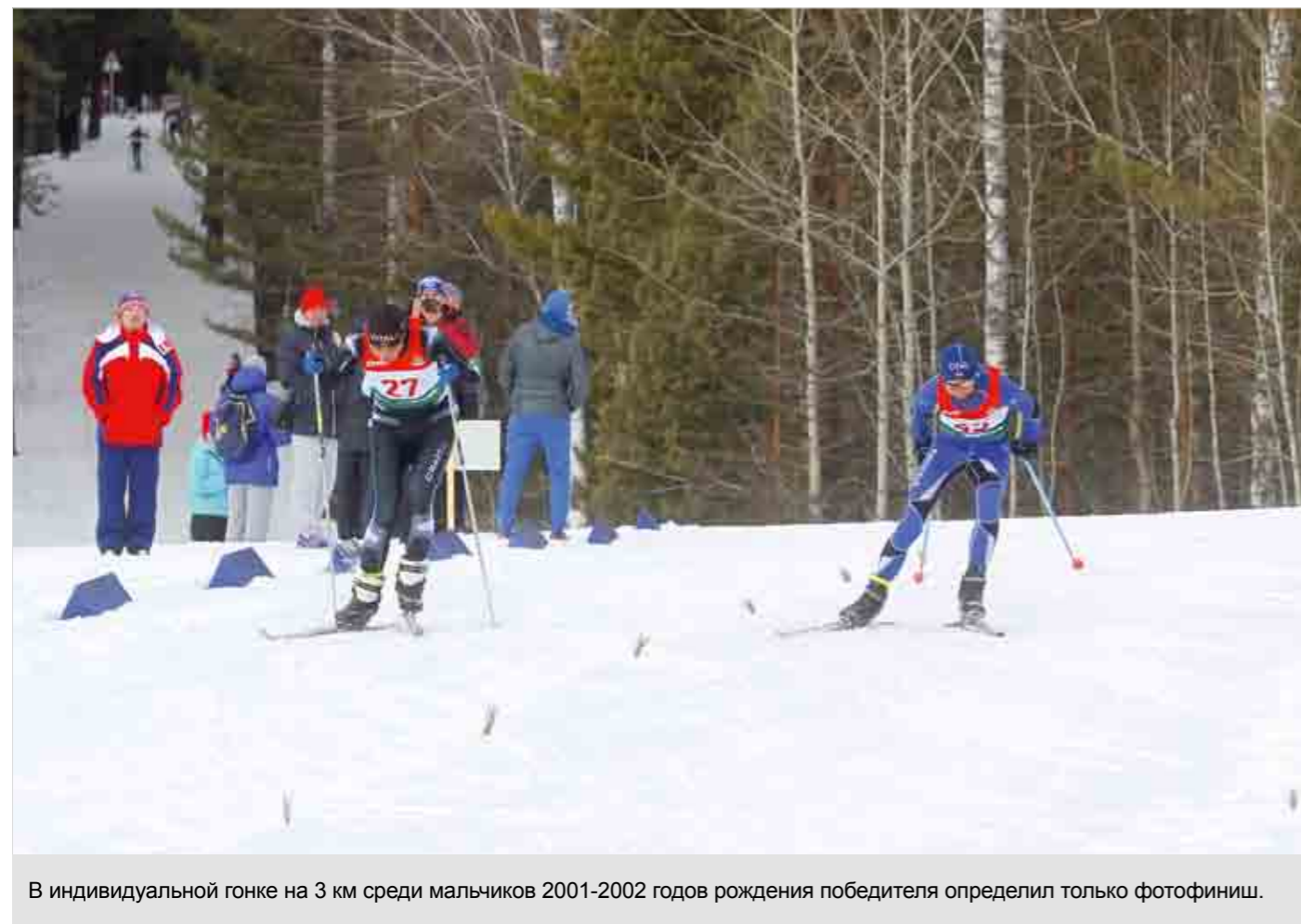
В индивидуальной гонке на 3 км среди мальчиков 2001-2002 годов рождения победителя определил только фотофиниш.

А на следующий день, конечно, один из самых любимых и зрелищных видов – эстафеты.