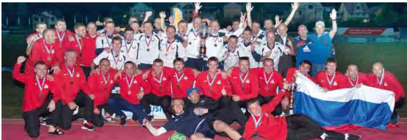
Совместная фотография братских сборных команд России и Белоруссии.

– Очень хочется сыграть. Да и вообще, если заболел футболом – это на всю жизнь.