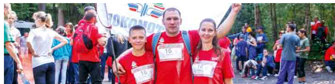
Члены команды Южно-Уральской железной дороги - победителя Туриады - с легендарным флагом..