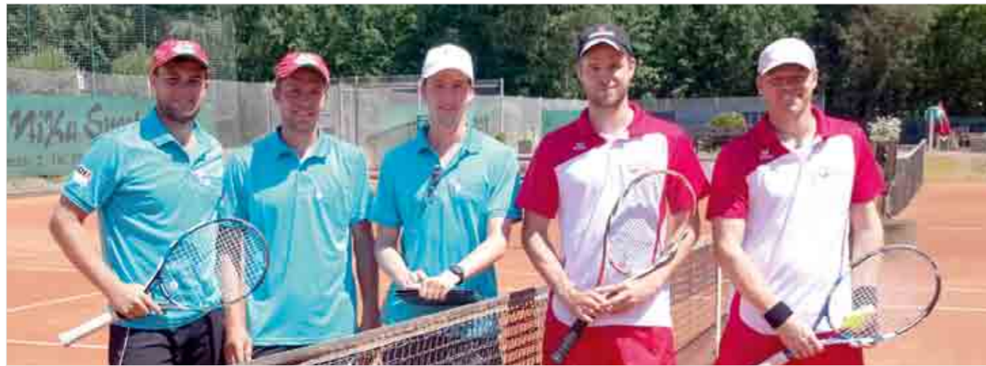
Судьба бронзовых медалей чемпионата определялась в парной встрече против австрийских железнодорожников.

своей игрой просто деморализовал соперника четкими подачами, приемами и игрой у сетки.