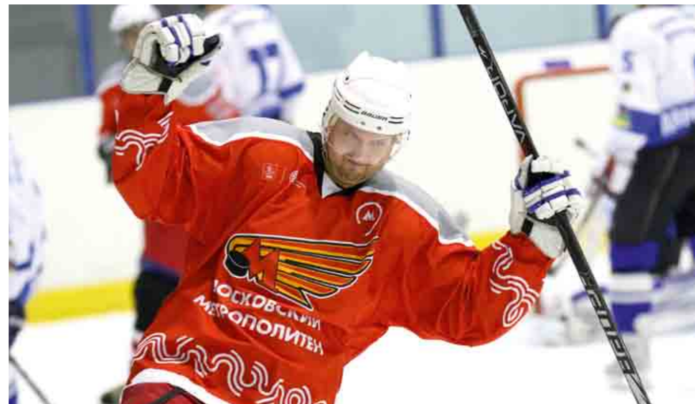
Дебют сборной команды Московского метрополитена на Кубке Роспрофжел по хоккею получился удачным.