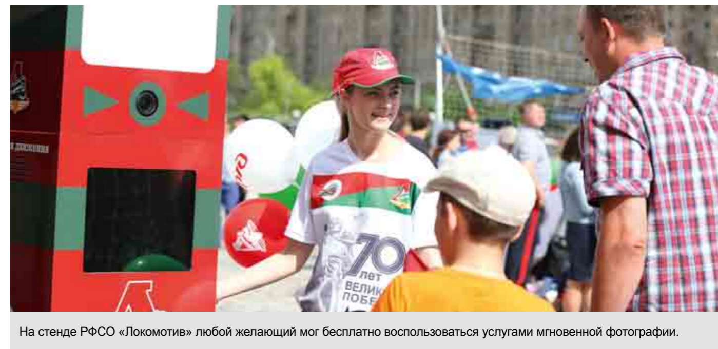
На стенде РФСО «Локомотив» любой желающий мог бесплатно воспользоваться услугами мгновенной фотографии.