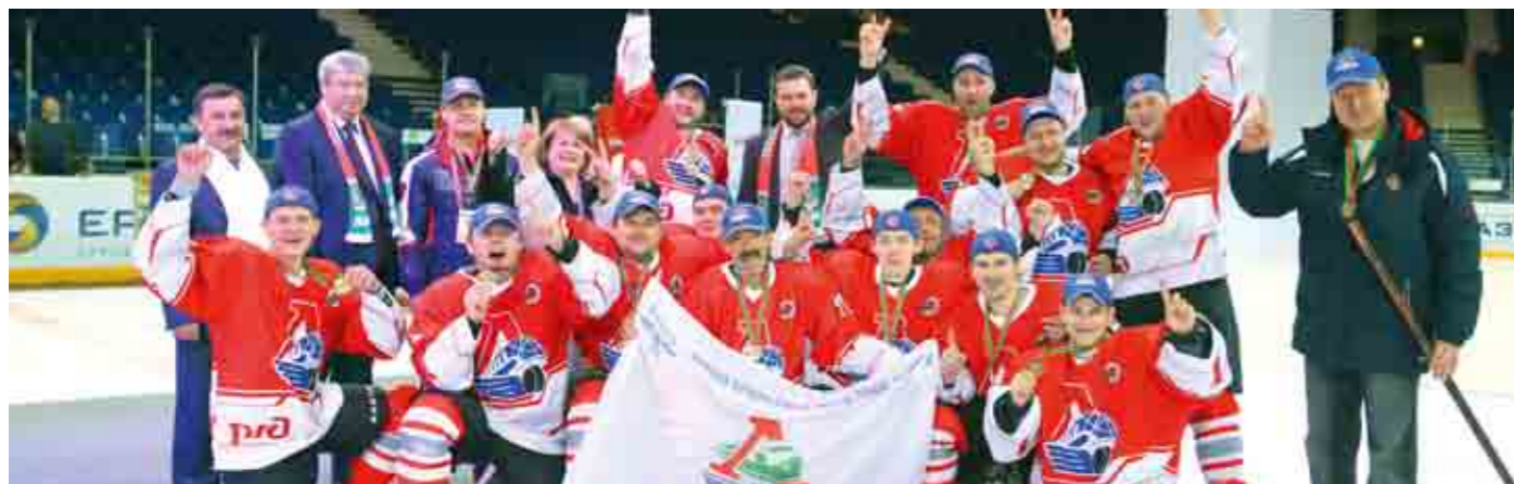
Обладатель Кубка Роспрофжел по хоккею – сборная команда Южно-Уральской железной дороги.