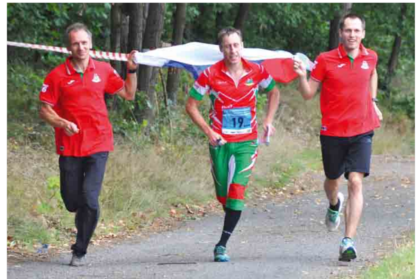
Финиш российской команды в мужской эстафете.