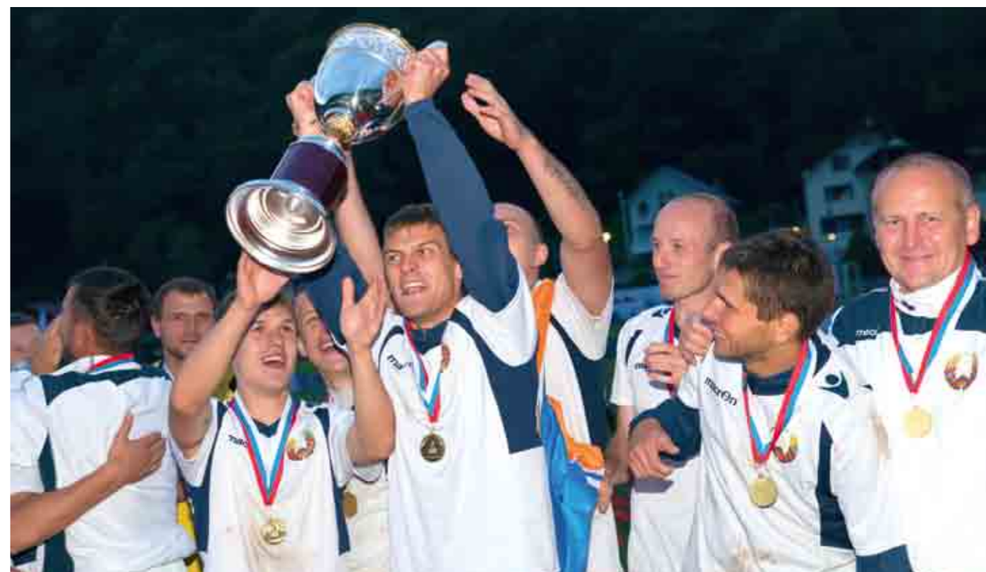
Главный трофей чемпионата по праву завоевали представители Республики Беларусь, вырвав победу у французской сборной в драматичной серии послематчевых пенальти.