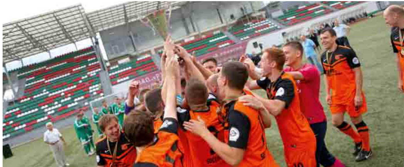
Команда ТрК выиграла Кубок ЖФЛ второй год подряд и третий раз в своей истории.