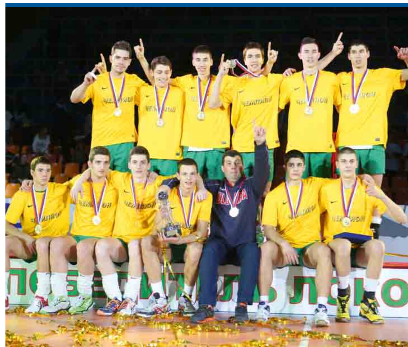
Победителями турнира стали волейболисты из Болгарии, переиграв в финале своих сверстников из Новосибирска.