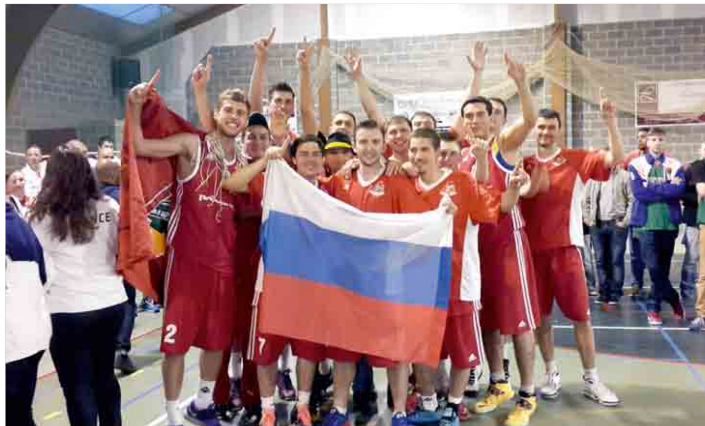
Российские железнодорожники спустя несколько минут после окончания решающей игры с французами или, как сказал один из игроков, 40 минут ада.

Овации, песни, поздравления от соперников завершили этот трудный, но очень счастливый день. Российские железнодорожники заслужили этот праздник, как никто! И какие бы трудности не возникали на их пути, теперь все знают, что русские не сдаются!