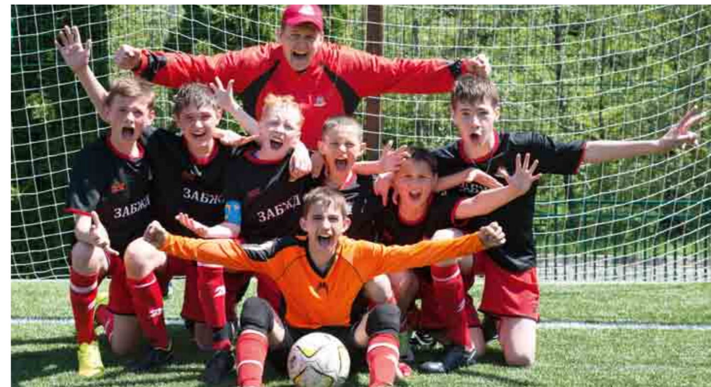
Победитель турнира по мини-футболу – команда Забайкальской железной дороги.

два километра на центральном стадионе Сочи. Здесь проводят сборы лучшие спортсмены страны, в том числе и наши олимпийцы.