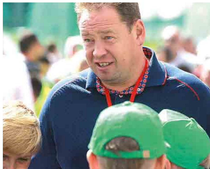
Леонид СЛУЦКИЙ, главный тренер ПФК ЦСКА:

– Мы проводим «Локобол» уже в девятый раз. В этом году в фестивале было больше 50 тысяч участников, были охвачены 80 субъектов Российской Федерации. А если считать с малыми населенными пунктами, то – более 700. Две с половиной тысячи детских коллективов. Это и есть изюминка и идея «Локобола» – даже дворовые футбольные команды могут принимать участие в турнире. Фестиваль растет и поднимается. И мы очень рады, что в этом году победил «Локомотив».