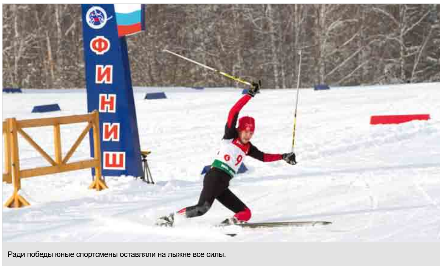
Ради победы юные спортсмены оставляли на лыжне все силы.

– Нам тренер никогда не ставит задачу победить во что бы то ни стало. Говорит: «Если проиграем – не расстраивайтесь, жизнь на этом не кончилась». Лыжные гонки – это так здорово! Тренировки всегда на улице, на свежем воздухе, на соревнованиях едешь, города смотришь, мир узнаешь. Конечно, не всегда такая волшебная погода. Бывает и мороз трещит, а на тренировку идти надо. Тем, кто этого боится я хочу сказать, что на лыжах всегда тепло! Ты активно работаешь, от тебя исходит энергия. В общем, правильно говорят: в здоровом теле – здоровый дух!