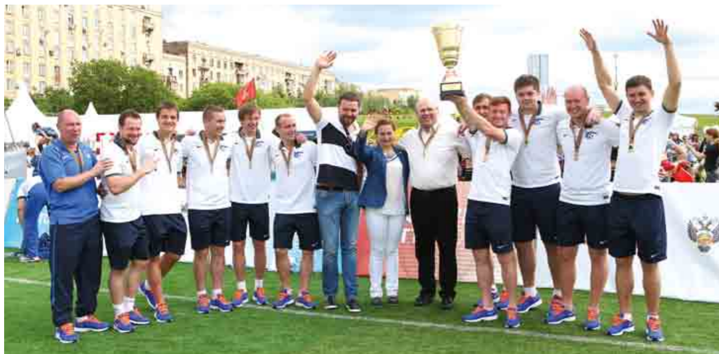
Обладатель Кубка НПФ «Благосостояние» по футболу - команда ТрК.

– На XI Физкультурно-спортивном форуме ГТО мы похвастаемся появлением «Гонки Героев». Это новое мероприятие, которое было приурочено именно к Форуму, и оно действительно для нас что-то новое и актуальное. Сейчас стране требуется, чтобы у людей возродился патриотизм. Мне кажется, первые сорок студентов, которые прошли через «Гонку героев», остались довольны. Девчонки даже предложили поучаствовать в этом мероприятии еще раз. Видимо, хотят улучшить свое время на финише или еще раз вкусить тот не совсем «девчачий» адреналин. Но что ж, у нас девушки и в армии служат.