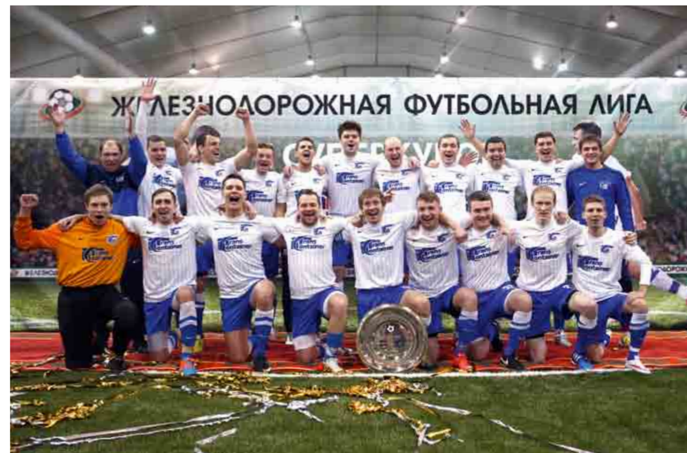
Обладатель первого в истории ЖФЛ Суперкубка – команда ТрК.