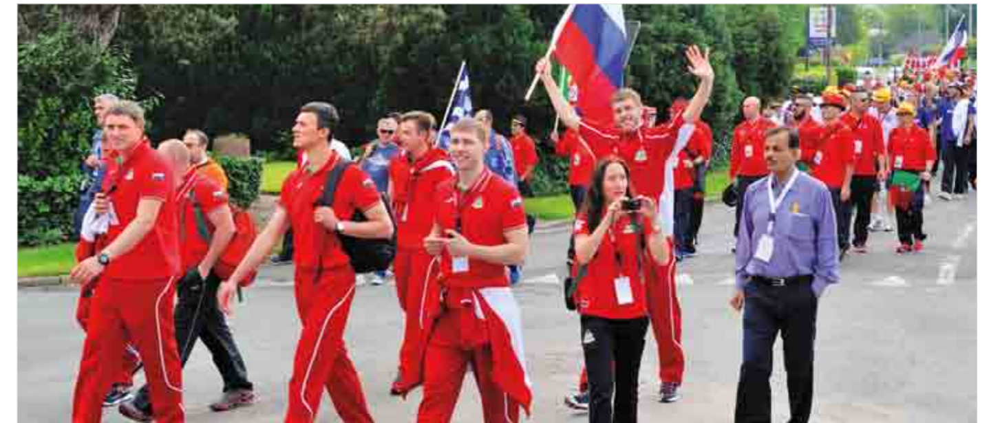
Парад открытия чемпионата. Торжественное шествие по улицам Профондвилля получилось красочным и запоминающимся не только для спортсменов, но и для жителей провинциального бельгийского городка. Участники соревнования чувствовали себя настоящими олимпийцами.

Второй игровой день на чемпионате мира среди железнодорожников по баскетболу оказался совсем нелегким для россиян. Во-первых, предстояло сыграть два матча. Во-вторых, с командами, которые на уровень выше греков, а это требовало дополнительной мотивации и физической нагрузки. Но со своей задачей российские железнодорожники справились достойно.