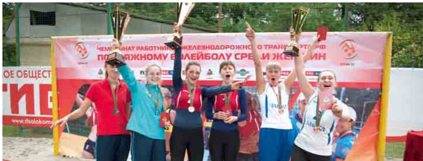
Призеры чемпионата по пляжному волейболу.

– У нас лучшие в городе корты для пляжного волейбола оборудованы на берегу реки Которосль. На Волге тоже есть два пляжа, где можно поиграть. Правда, песок не такой, как здесь. Речной, с камушками.