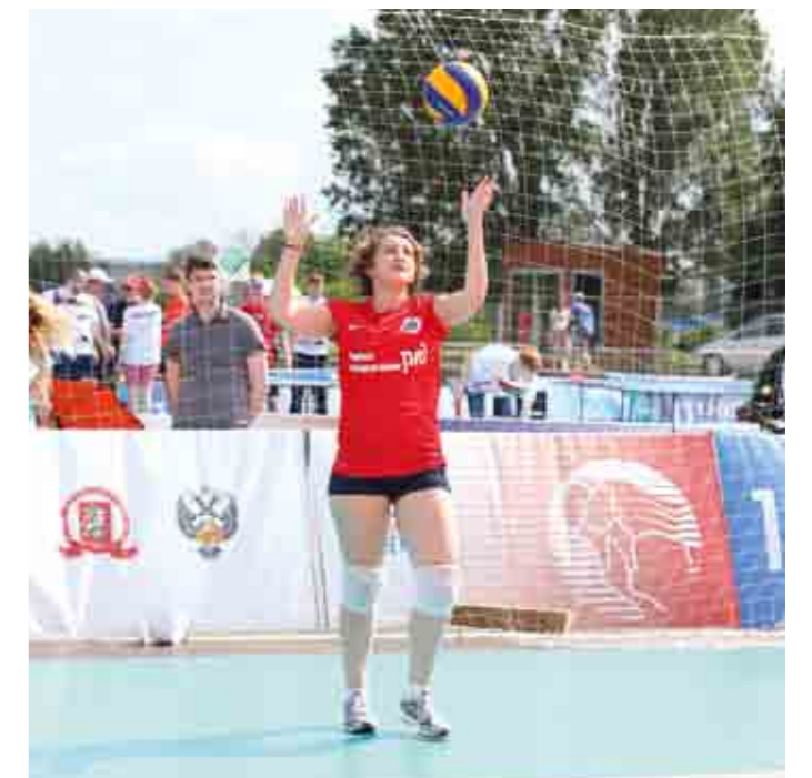
Волейбол среди железнодорожников не уступает в популярности спорту №1 в мире – футболу.

Мини-футбольная дружеская встреча стала настоящим украшением дня. Собралось много зри-