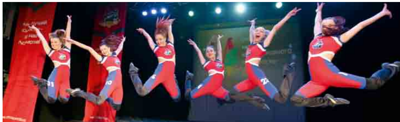
Группа поддержки ХК «Локомотив» (Ярославль).

– Для многих это станет открытием, но гири поднимают ногами. Это известно любому человеку, который увлекается нашим видом спорта. Спина – фактор номер два.