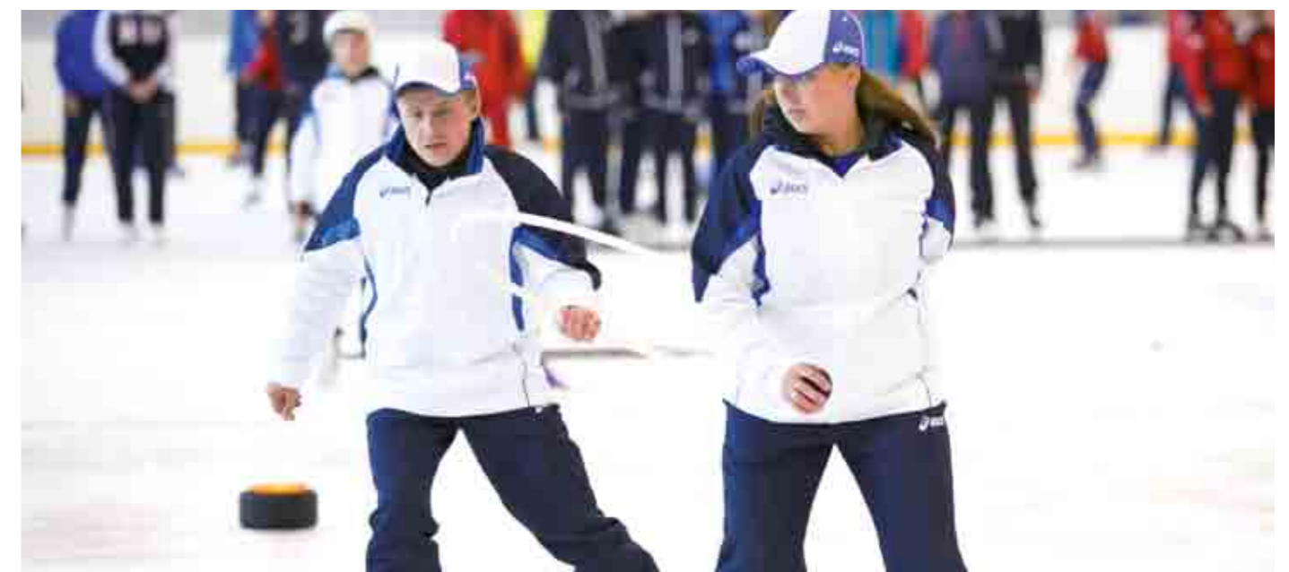
Новый для многих участников Туриады этап - ледовые старты - позволил расширить круг претендентов на победу и повысить интерес к соревнованиям.

После обеда железнодорожников ждала «Туристическая эстафета». Тут нужен целый комплекс умений необходимых в походе – собрать палатку, перелезть через яму по канату, упаковаться в спальный мешок, спуститься со страховкой по обрыву... Ну а в заключение побросать мячи в баскетбольное кольцо – на меткость. Лучшими тут оказались калининградцы. Но главное – погода не подкачала. А от Балтийской природы все были в восторге.