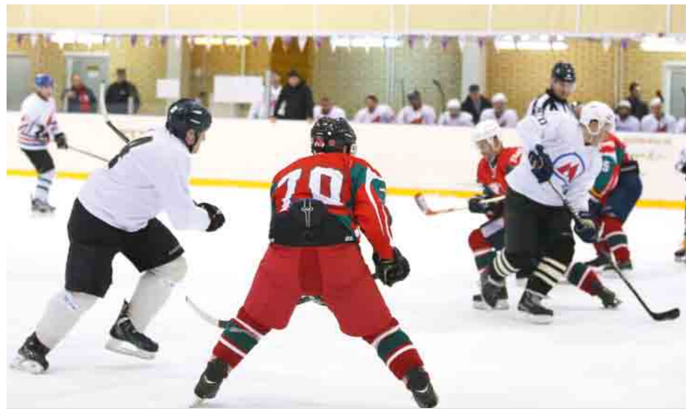
Для хоккеистов Московского метрополитена турнир стал генеральной репетицией перед поездкой на II Кубок Роспрофжел по хоккею в Ярославль.

В финальном матче Кубка хозяева к десятой минуте встречи уже вели – 3:0. Была вязкая игра. МЕТРО старался отыграться, но шайба упорно не шла в ворота. Болельщики подбадривали Московский Метрополитен плакатами. На одном из полотен было персональное обращение: «Гребнюк вперед!» Однако опытный защитник не смог спасти свою команду от четвертого гола МЖД.