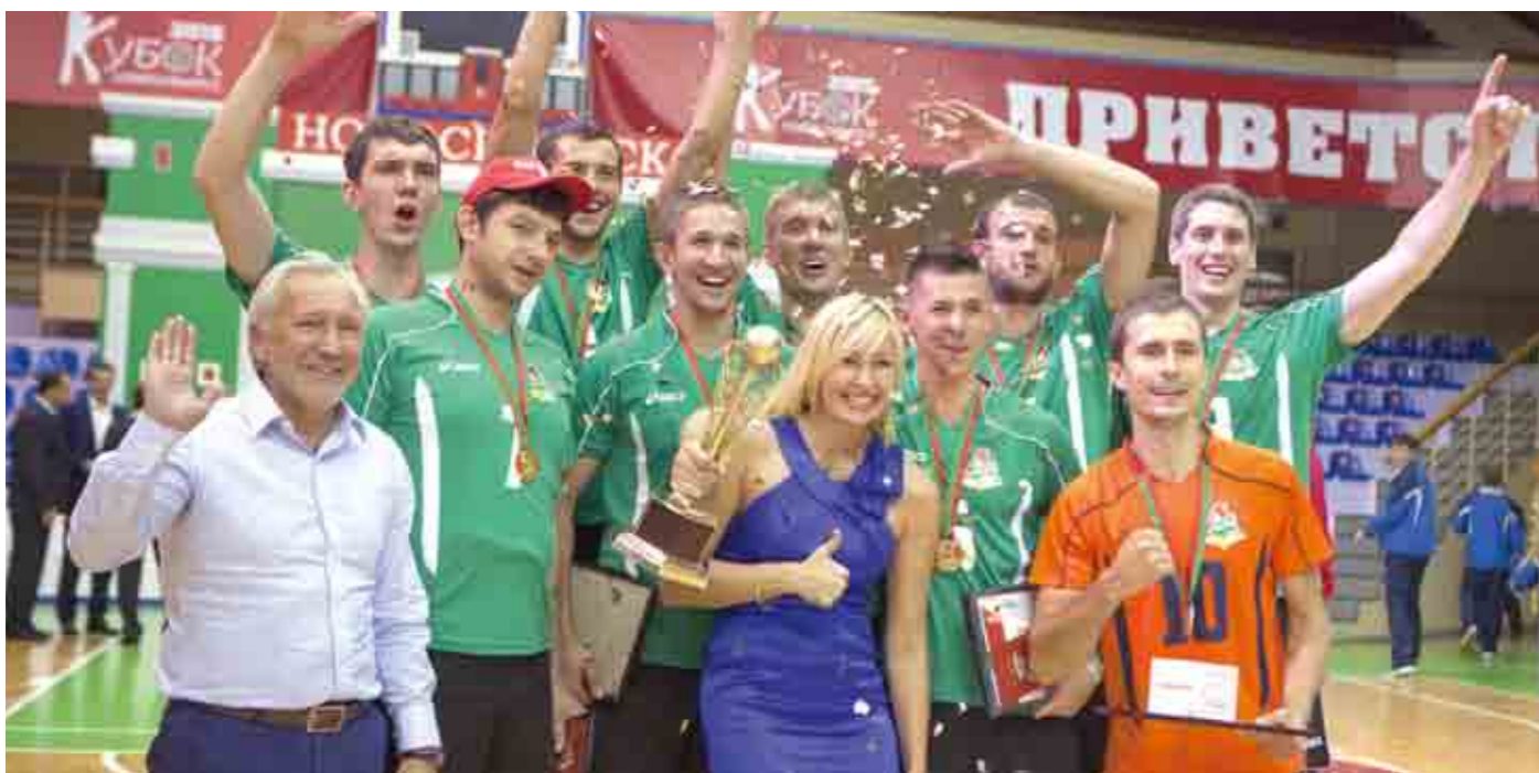
Победитель Кубка президента ОАО «РЖД» – сборная Красноярской железной дороги.