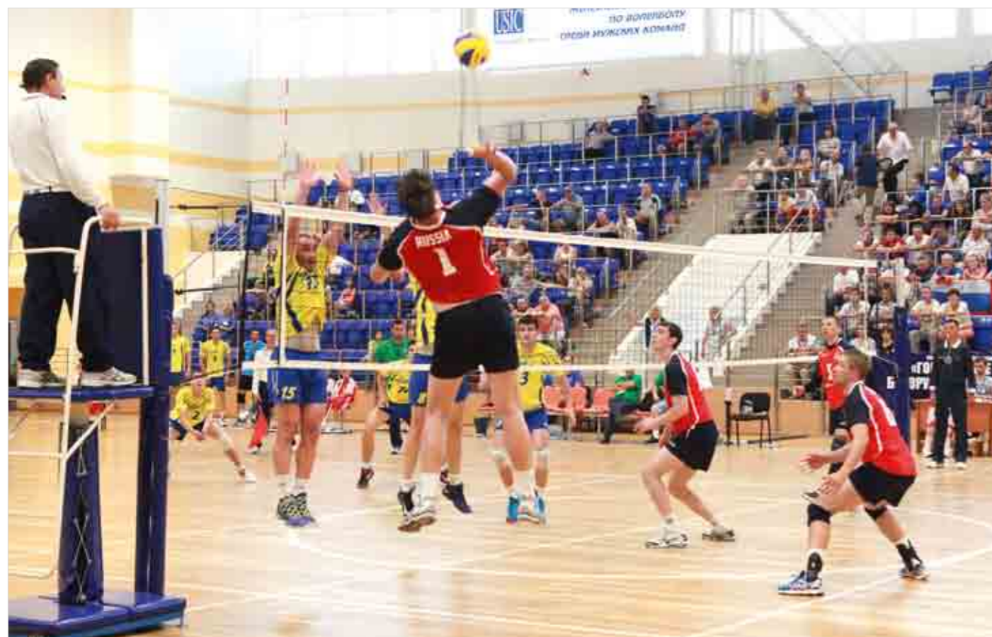
Полуфинальный матч против болгарских железнодорожников длился почти два с половиной часа.

Пожалуй, более комфортного места для проведения турнира для россиян сложно было и придумать. Даже на рынке, узнав, что мы из России говорят «Желаем вам победы», «Мы за вас болеем» и даже не важно, о каком турнире идет речь, хотя о чемпионате МССЖ в Гомеле знают