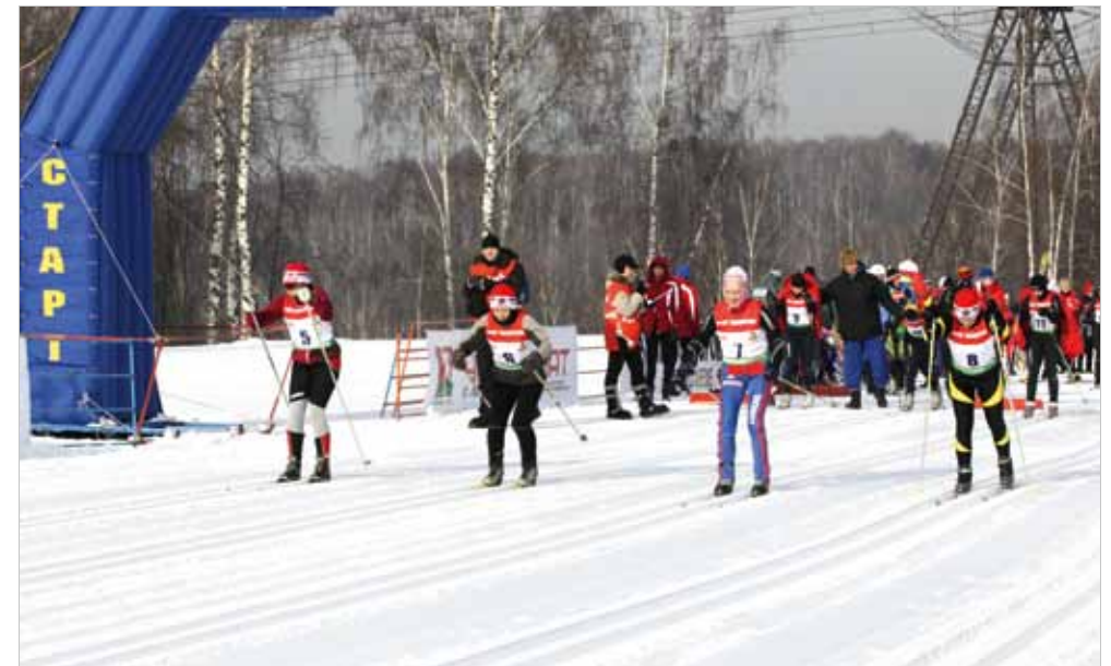
В 2012-м году соревнования по лыжным гонкам выделили в самостоятельный чемпионат, который прошел в подмосковном Красногорске.

Четвертый Чемпионат и Первенство по лыжным гонкам в 2015-м году снова состоялись на трассах красноярской «Академии биатлона». Победу в общекомандном зачете Чемпионата праздновала команда Западно-Сибирской магистрали, оставив позади горьковчан и хозяев красноярцев. Лучшей сборной Первенства стала команда из Восточной