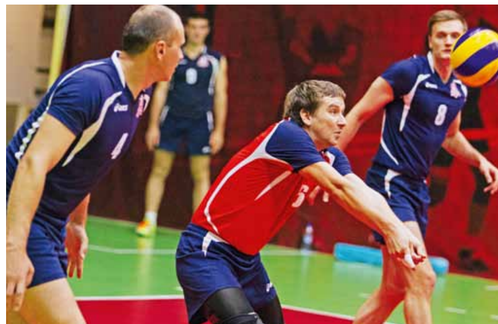
Открытием Кубка президента ОАО «РЖД» по волейболу 2016 стала команда Московской ж.д.

В результате квартет, бившийся за медали в плей-офф, выглядел так: команда Запсиба, свердловчане, уже не раз добивавшиеся до финала соревнований и завоевывавшие кубок, стремительно прогрессирующие забайкальцы и неожиданно для многих – москвичи, которые в прошлом розыгрыше Кубка были только вось-