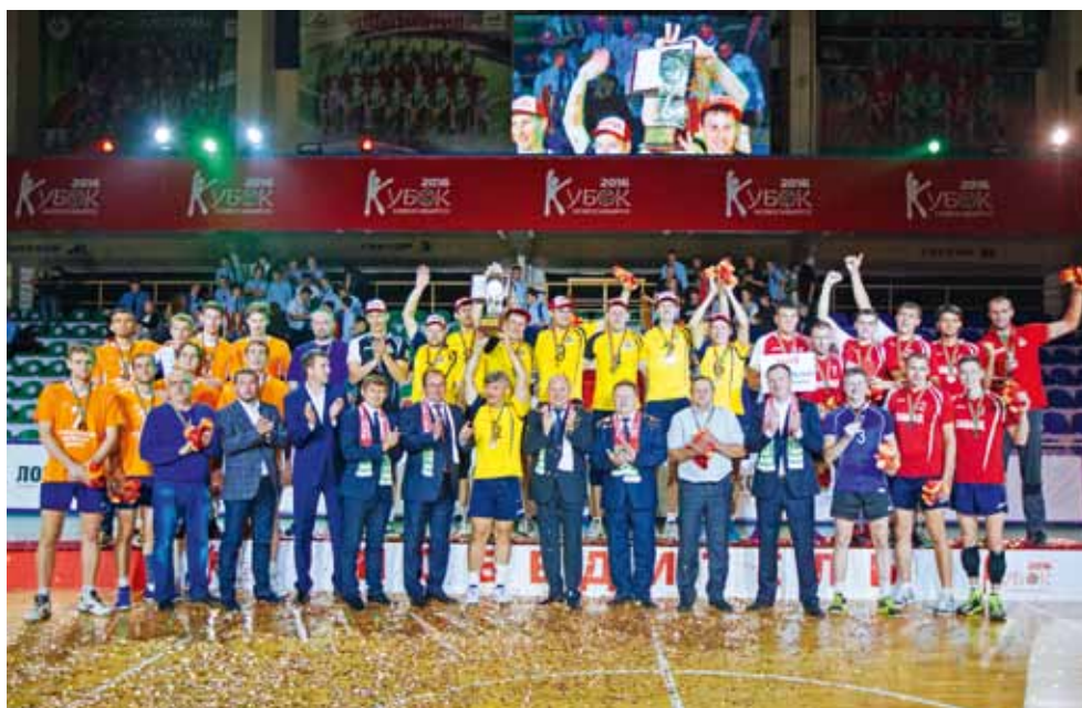
Победитель и призеры Кубка президента ОАО «РЖД» по волейболу 2016.

За время проведения турнира его гостями были президент ОАО «РЖД» Владимир Якунин, губернаторы, начальники дорог, министры спорта областей и краев.