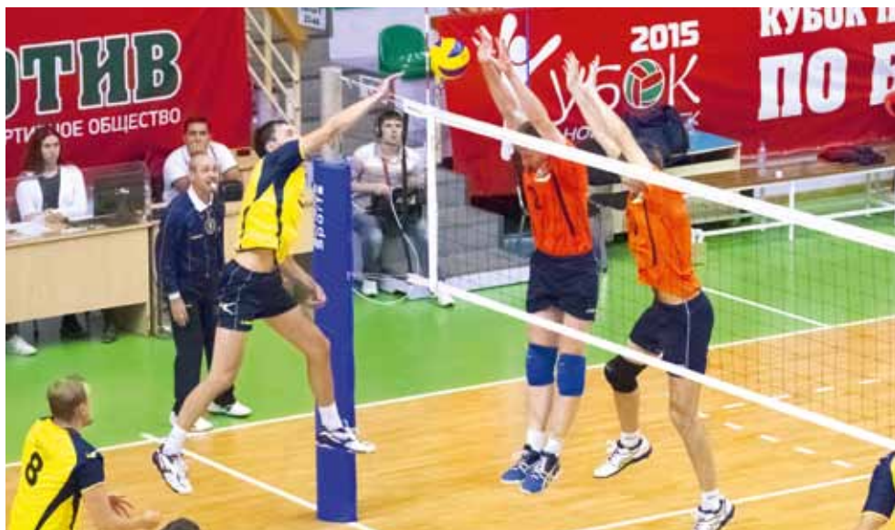
Матч за третье место получился сибирским дерби. В нем встречались команды Западно-Сибирской (справа) и Восточно-Сибирской железной дороги.