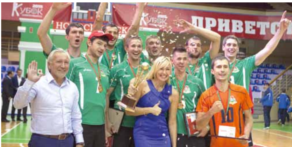
Победитель Кубка президента ОАО «РЖД» - сборная Красноярской железной дороги.