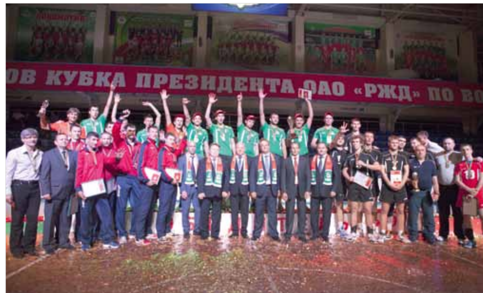
Победители и призеры Кубка президента ОАО «РЖД» по волейболу.

Вот и в этом году Свердловская ж.д. оказалась в втором месте. Западно-Сибирская ж.д. завоевала «бронзу». А представители южных, центральных и западных регионов в этот спор вмешаться не смогли. Никто из них в полуфинал не пробился. Не пора ли подтянуться?