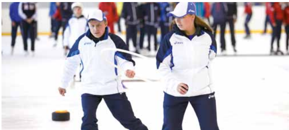
Новый для многих участников Туриады этап - ледовые старты - позволил расширить круг претендентов на победу и повысить интерес к соревнованиям.

После обеда железнодорожников ждала «Туристическая эстафета». Тут нужен целый комплекс умений необходимых в походе – собрать палатку, перелезть через яму по канату, упаковаться в спальный мешок, спуститься со страховкой по обрыву... Ну а в заключение побросать мячи в баскетбольное кольцо – на меткость. Лучшими тут оказались калининградцы. Но главное – погода не подкачала. А от Балтийской природы все были в восторге.