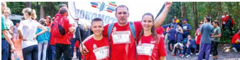
Члены команды Южно-Уральской железной дороги – победителя Туриады – с легендарным флагом..

– Я сама кандидат в мастера спорта по плаванию, и муж тоже много времени проводит в бассейне на тренировках. Поэтому мы своим примером стараемся и сына приобщить именно к этому виду спорта, но он отдает больше предпочтения силовым видам – боксу и хоккею, и мы с папой не очень протестуем, главное, ведь, чтобы ребенок занимался спортом, а каким именно – это не очень важно.