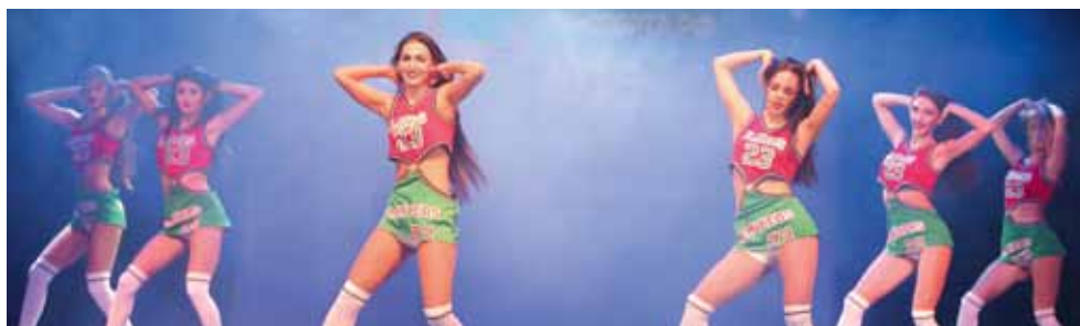
Группа поддержки БК «Локомотив-Кубань» (Краснодар).

– Нам рассказали регламент, поэтому мы знали что будет. Некоторые номера были заготовлены, а в конкурсе капитанов пришлось импровизировать, как и еще в одном конкурсе.