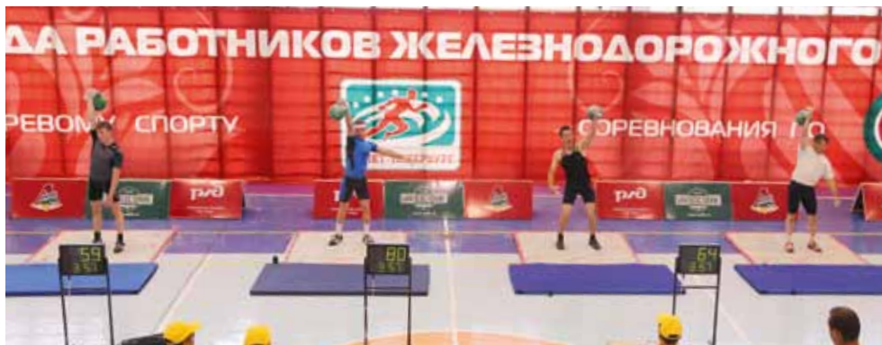
В соревнованиях по гиревому спорту команда Московской железной дороги не оставила своим коллегам с Западно-Сибирской магистрали шансов на повторение прошлогоднего успеха.