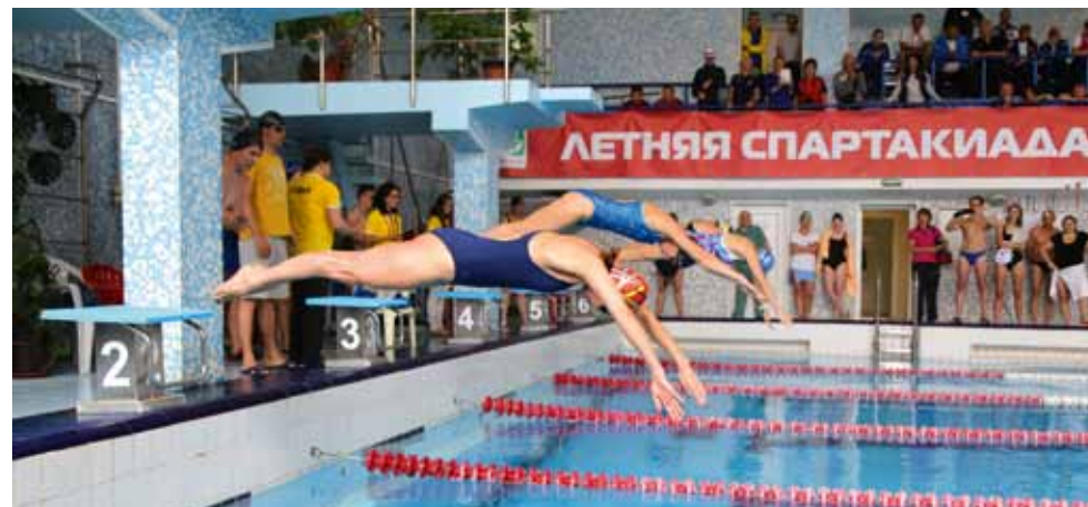
Победа в смешанной эстафете 4x50 м принесла Куйбышевской железной дороге и победу в командном зачете соревнований по плаванию.