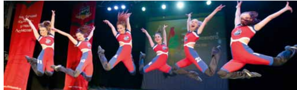
Группа поддержки ХК «Локомотив» (Ярославль).

– Для многих это станет открытием, но гири поднимают ногами. Это известно любому человеку, который увлекается нашим видом спорта. Спина – фактор номер два.