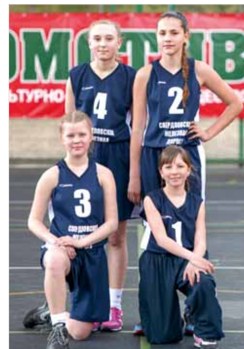
Победитель турнира по стритболу среди девочек - команда Свердловской железной дороги.