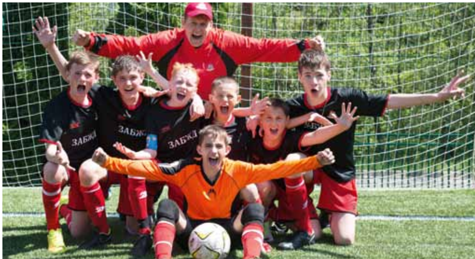
Победитель турнира по мини-футболу – команда Забайкальской железной дороги.

два километра на центральном стадионе Сочи. Здесь проводят сборы лучшие спортсмены страны, в том числе и наши олимпийцы.