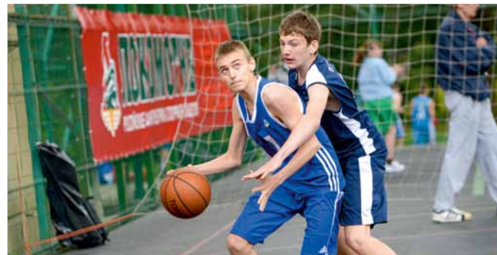
На турнире по стритболу среди мальчиков вне конкуренции оказалась сборная Южно-Уральской железной дороги.