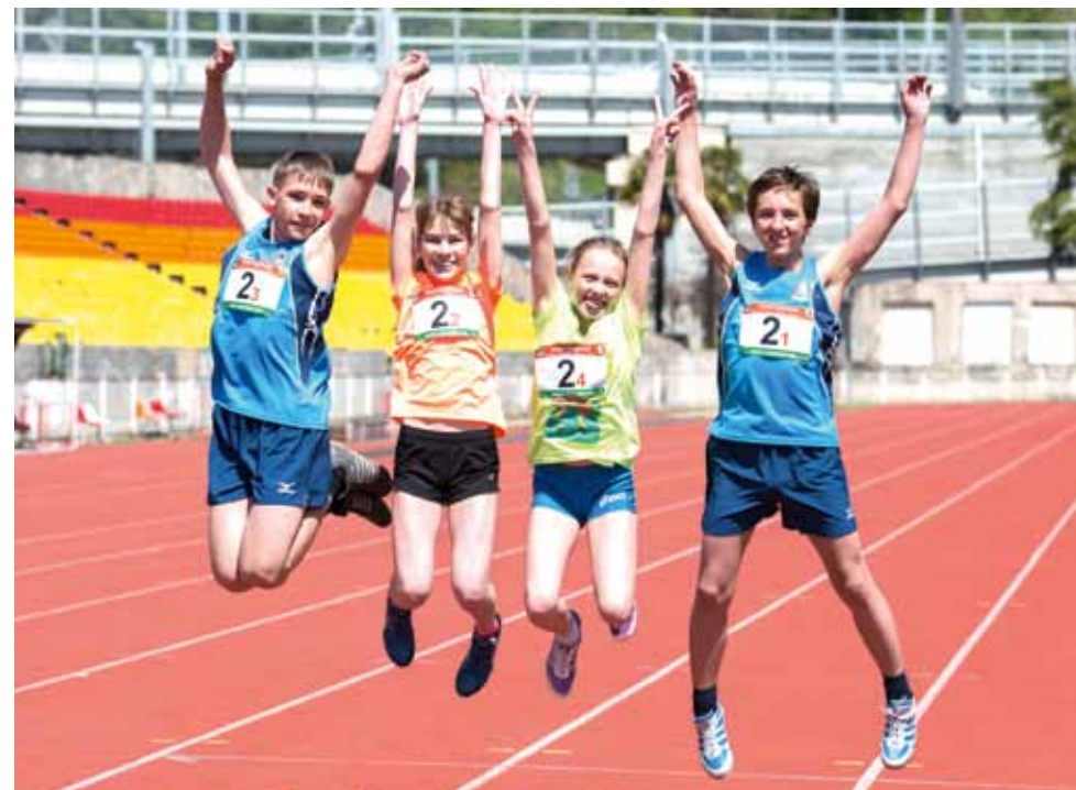
Легкоатлеты Забайкальской магистрали - победители в смешанной эстафете 4x200 м.

Легкоатлеты забайкальцев - победители в смешанной эстафете 4x200 м.