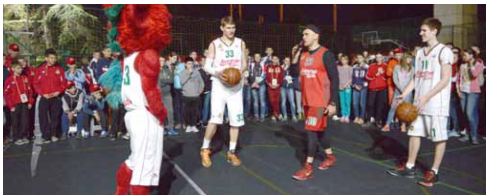
Юные спортсмены с удовольствием поучаствовали в мастер-классе игроков баскетбольного клуба «Локомотив-Кубань».

Отдельная тема соревнований – мастер-классы от известных игроков. Юных футболистов учили чеканить мяч чемпионы мира по пляжному фут