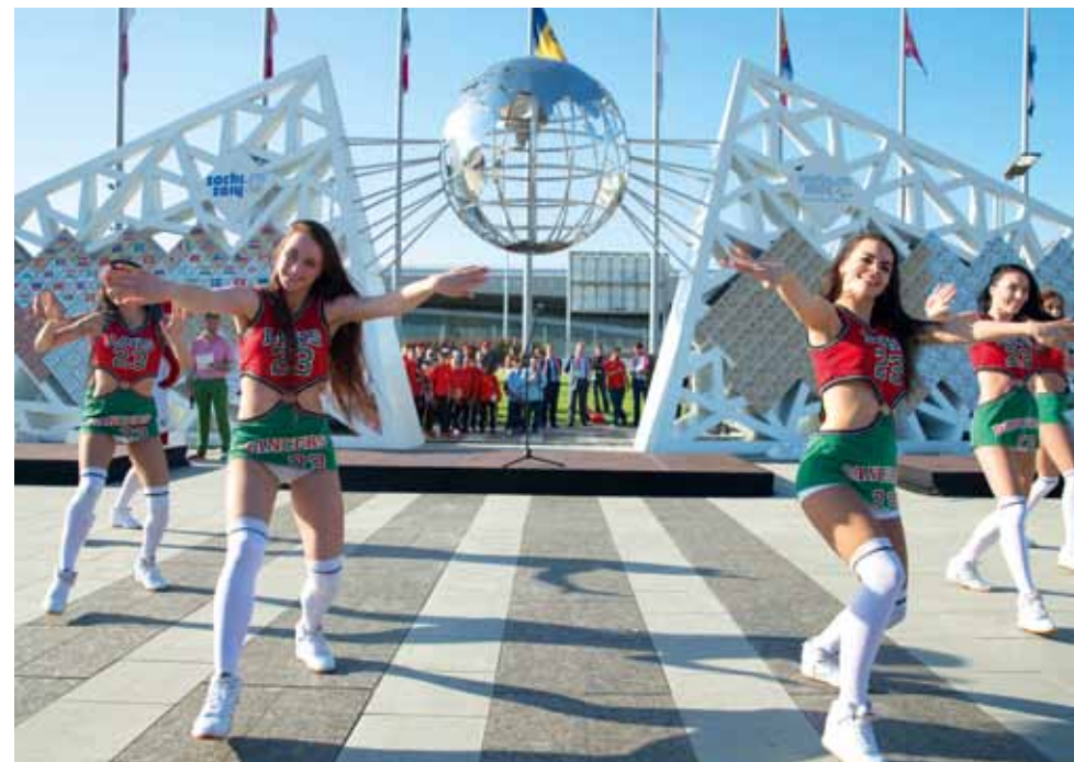
На церемонии закрытия для юных спортсменов выступила специально приглашенная группа поддержки баскетбольного клуба «Локомотив-Кубань».

Конечно, не зря. Ведь в итоге вы обыграли всех не только в футбольном турнире. Но и впервые в истории выиграли Спартакиаду.