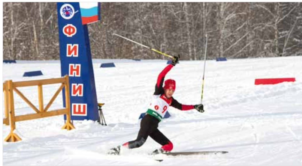
Ради победы юные спортсмены оставляли на лыжне все силы.

— Эстафета, в отличие от личной гонки — это всегда ответственно, всегда волнующе. Я считаю, что для меня гонка сложилась вполне благоприятно, свой этап я отработала хорошо, а девушки нашей команды закрепили и улучшили общекомандный результат. Мы выполнили то, что для себя намечали. Хочу отметить, что красноярская трасса очень интересная, очень рабочая. Погода, конечно, весьма своеобразная. Нашим сервисменам приходилось колдовать, но и они тоже сегодня выше всех похвал.