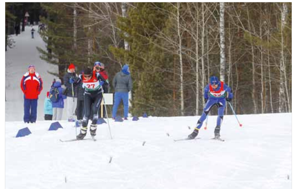
В индивидуальной гонке на 3 км среди мальчиков 2001-2002 годов рождения победителя определил только фотофиниш.

А на следующий день, конечно, один из самых любимых и зрелищных видов – эстафеты.