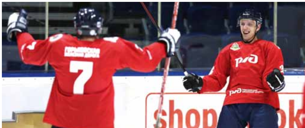
Хоккеисты Горьковской железной дороги радовались победе в полуфинале так, будто выиграли Кубок Гагарина.

куйбышевцы уступили в обеих своих встречах (0:11 Южному Уралу и 1:13 команде Западно-Сибирской железной дороги), зрители запомнили эту боевую команду.