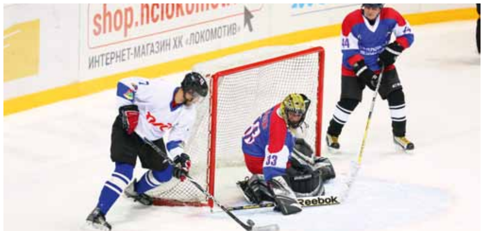
Матч за 5 место между командами Свердловской и Западно-Сибирской железных дорог.

К финальному матчу зрителей на трибунах «Арены-2000» заметно прибавилось. «После такого турнира мы получим дополнительный импульс для развития хоккея. Признаться, не ожидали, что в Ярославле на игры придет большое количество болельщиков, ведь команды-участницы известны только среди железнодорожников», - отметил председатель РОСПРОФЖЕЛ Николай Никифоров.