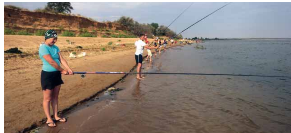
Конкурс «Спортивная рыбалка» стал особенностью «Туриады-2014».