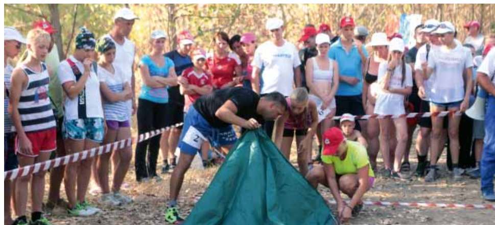
Семья Васиных (ОКТ) ставит палатку.

Все участники «Туриады» признались, что им очень нравятся эти соревнования. Все готовятся, тренируются. Взрослые начинают ходить в спортзал, а дети записываются в спортивные секции. А это значит, что главная задача «Туриады» -- привлечь семьи железнодорожников к спорту удалась!